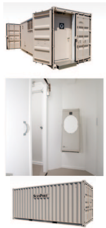
Рис. 4. Внешний и внутренний вид системы ScanPort

Задача сокращения хищений, совершаемых как покупателями, так и персоналом (борьба с недочётами), актуальна во все времена. В крупных магазинах самообслуживания (гипермаркетах, супермаркетах и т. д.) нередки ситуации, когда осуществляются попытки выноса товара без оплаты, при этом сотрудники безопасности вынуждены вступать в конфликт с «покупателями». С другой стороны, возможен