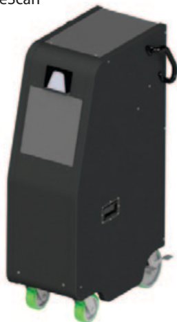
Рис. 3. Внешний вид мобильной установки MobileScan

гих отличительных особенностей можно отметить продолжительный срок службы и долговечность, работа с устройством не требует наличия высококвалифицированных операторов, возможно обучение персонала через интернет-сервисы. Согласно паспортным данным эксплуатация сканера допускается только внутри помещений при положительных температурах окружающей среды.